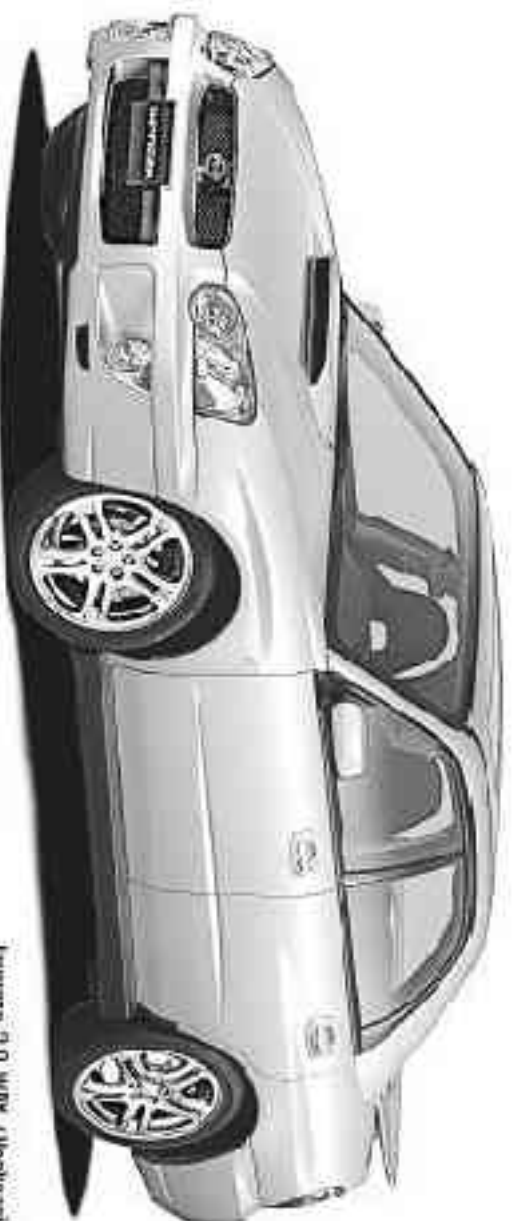
Impreza 2.0 WRX (heckschiele Sonderausstattung)

Der Subaru Impreza 2.0 WRX – das ist der sportliche Herausforderer in der Kompaktklasse. Sein Design ist ausdrucksstark, seine Serien-Sicherheitsausstattung mehr als großzügig: permanenter Allradantrieb AWD, Fahrer-, Beifahrer- und Seiten-Airbags mit integrierten Kopf-Airbags, ABS, Sicherheits-Bremspedal und vieles mehr. Und: Seinen durch-